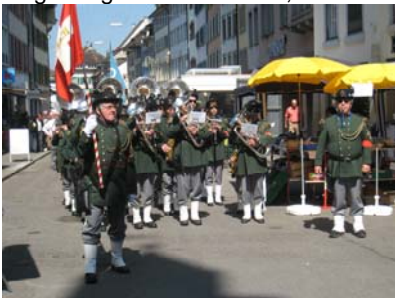
Umzug durch Liestal