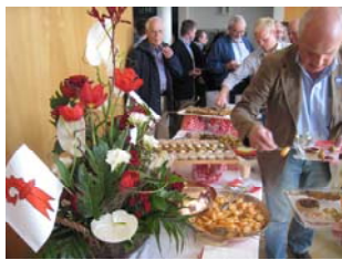
Apéro in Liestal