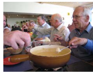
Fondue für 135 Personen