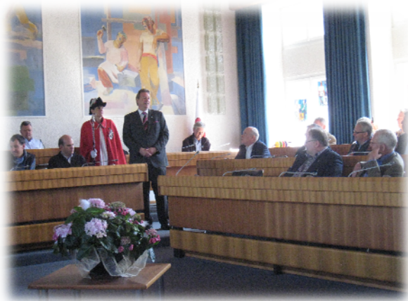
... und im Landratssaal in Liestal