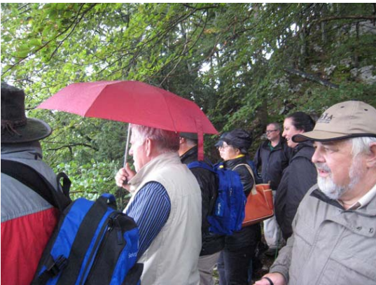
Abstieg vom Weissenstein im Regen