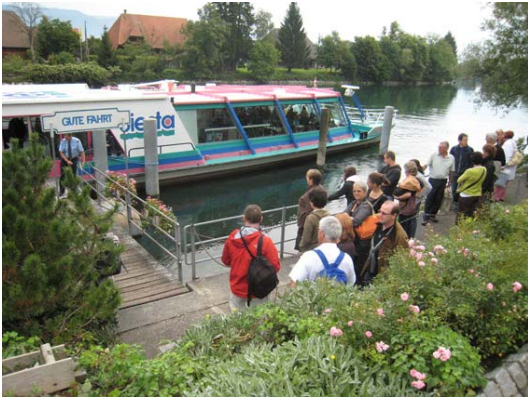
Aarefahrt von Wangen a. A. bis Solothurn