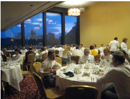
Das Zunftspiel beim Nachtessen