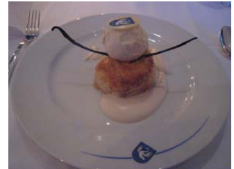
Bachne Öpfel, Bündherrööteli Sabayone, Vanillglasse