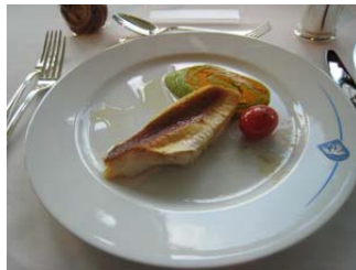
Brates Chnurrhahnfilet, Rüebli-Bärlauchroulade