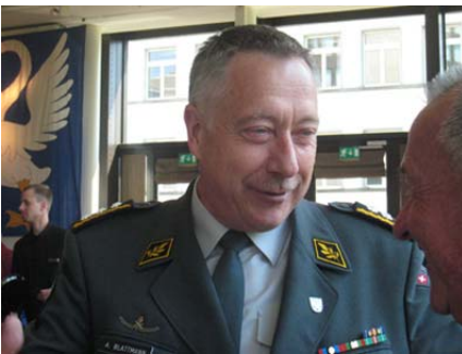
Korpskommandant André Blattmann

Das Sechseläuten 2009 wird als schönes und gelungenes Frühlingsfest in die Annalen der Stadtzunft Zürich eingehen. Um 9. 45 Uhr trafen sich die Mitglieder der Stadtzunft mit Ihren Ehrengästen und den zahlreichen Gästen zum Apéro im Marriott Hotel Zürich. Das exzellente Mittagessen in der schönen Zunftstube wurde umrahmt von wirklich guten Reden und Gegenreden sowie von einem beschwingten Konzert des Zunftspiels. Kurz nach 15.30 Uhr begann der «lange Marsch» bei schönem Frühlingswetter durch die Stadt zum Warteraum und von dort auf der Umzugsroute zum Sechseläutenplatz. Schon kurz nach dem Eintreffen segnete der Böögg das Zeitliche. Nach einem feinen Nachtessen begab sich der grosse Auszug ins Niederdorf zu Besuchen bei den Zünften Hottingen, zur Schmiden und zum Weggen. Auf der Zunftstube der Stadtzunft erschienen die Auszüge der Zünfte zu den Drei Königen, St. Niklaus und zum Weggen. Kurz vor 2 Uhr konnte der Statthalter ein schönes und erlebnisreiches Sechseläuten 2009 offiziell beenden.