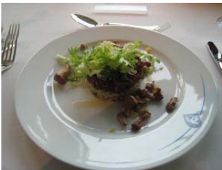
Bündnerfleisch tatar, Roll- gerschte, Eierschwämmli