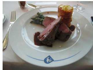
Rosa Lammnierstück, Hård- öpfelöstock, Spargelspitze