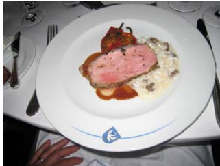
Chalbschrüüterbrate Morchlärisotto, Peperoni