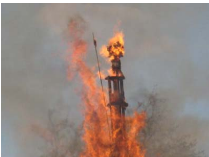
Die letzten Augenblicke des Bööggs (18:12:30)

Um etwa 14 Uhr meldete sich der Reiterchef mit der Reitergruppe, begleitet von den besten Wünschen des Zunftmeisters, zur Vorbereitung des Ritts zum Böögg ab. Dann marschierte das Zunftspiel, angeführt von der Tambourgruppe, in die Stube ein und erfreute die Anwesenden mit einem beschwingten Konzert.