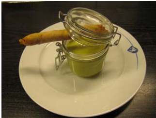
Soubohnesuppe, pikant Chorizo Zigarre