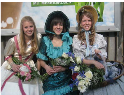
Ehrendamen: Warten auf den Zug zum Böögg