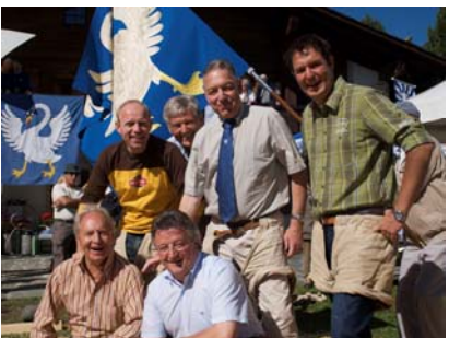
Die Macher des Tages