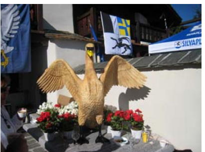
Der stolze Schwan

Die Stadtzunft Zürich führte am 5. und 6. September 2009 den Herbstausflug ins Oberengadin und ins Puschlav durch. Am Vortag führten die Golfer ein Turnier in Zuoz-Madulain durch. Am Samstag erlebten die 140 Teilnehmenden bei herrlichem Wetter in Champfèr ein veritables Schwing- und Älplerfest mit einem ausgedehnten Festmahl am Abend. Der zweite Tag führte die gut gelaunte Gesellschaft, erneut bei strahlendem Herbstwetter, per Bahn über den Berninapass nach Poschiavo. Auf dem wunderschönen Dorfplatz wurde das Abschiedsmahl genossen. Den Abschluss des unvergesslichen Anlasses bildete eine Busfahrt über den Berninapass nach Pontresina.