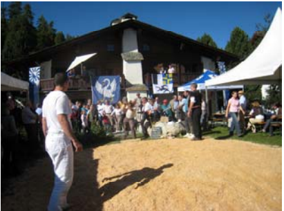
Festplatz Chesa Muntanella