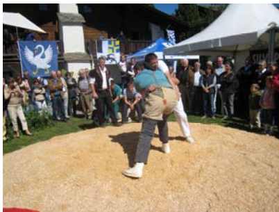
Schwinger in Aktion