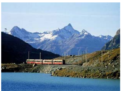
Auf dem Berninapass